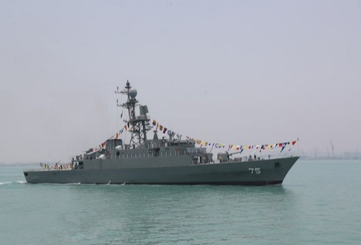
ఢిల్లీ : భారత్ తూర్పు తీరంలో జరిగిన నౌక విన్యాసాల్లో పాల్గొని తిరిగి వెళుతున్న ఇరాన్ యుద్ధ నౌకకు అమెరికా ముంచివేసిన విషయం తెలిసింది. విశాఖలో జరిగిన విన్యాసాల్లో పాల్గొన్న ఈ నౌక శ్రీలంక సమీపానికి చేరుకుంది. అప్పటికే అమెరికా, ఇజ్రాయెల్తో ఇరాన్ యుద్ధం కొనసాగుతున్న నేపథ్యంలో... ఐరిస్ దేనా అనే ఈ యుద్ధ నౌకపై అమెరికా దాడి చేసింది. ఈ దాడిని భారత అతిథిపై జరిగిన దాడిగా ఇరాన్ మంత్రి అభివర్ణించగా, భారత ప్రభుత్వ వర్గాలు దీనిని కొద్దిపాఠేతాయి. ఐరిస్ దేనా మీద దాడిపై ఇరాన్ - మిగతా 2 లో