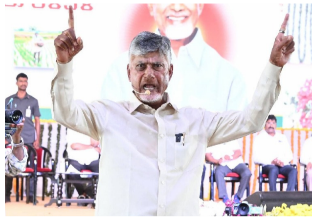
అమరావతి : వెలిగొండ ప్రాజెక్టుకు శంకుస్థాపన చేసి సరిగ్గా 30 ఏళ్లు పూర్తయ్యింది. ఈ సందర్భాన్ని పురస్కరించుకుని ఆంధ్రప్రదేశ్ ముఖ్యమంత్రి చంద్రబాబు సోషల్ మీడియా వేదికగా స్పందించారు. "వెలిగొండకు శంకుస్థాపన చేసింది నేనే... పూర్తి చేసి నీళ్లు ఇచ్చేది నేనే" అని ఆయన స్పష్టమైన ప్రకటన చేశారు. ఉమ్మడి ప్రకాశం జిల్లా రైతాంగం చిరకాల వాంఛ అయిన ఈ ప్రాజెక్టు పనుల పురోగతిని, భవిష్యత్ కార్యచరణను ఆయన ప్రజలతో పంచుకున్నారు. 1996 మార్చి 5వ తేదీ తనకు ఇంకా స్పష్టంగా గుర్తుందిని చంద్రబాబు పేర్కొన్నారు. ఆనాడు ఉమ్మడి ప్రకాశం - మిగతా 2 లో